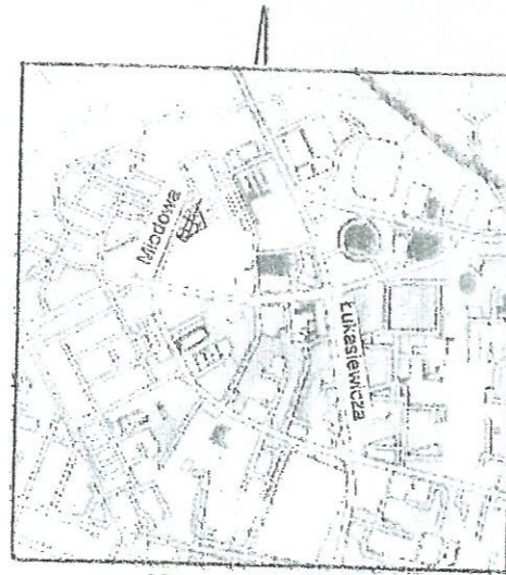
SZKIC ORIENTACYJNY SKALA 1:25000